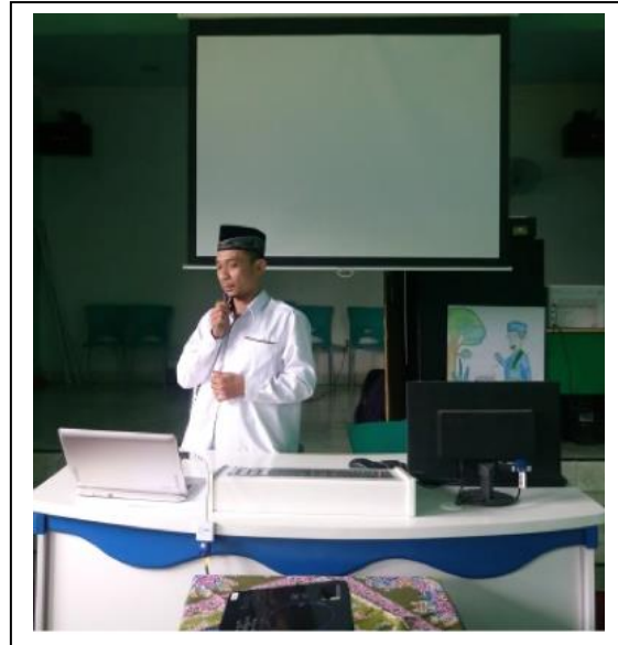
Gambar 2. Kata Sambutan Ketua Yayasan Ponpes Ar Rahman Palembang

Bahan ajar interaktif yang telah disajikan dapat menjadi masukan bagi guru guna menambah pengetahuan, wawasan dalam memudahkan proses