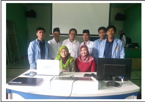
Gambar 5. Foto Bersama