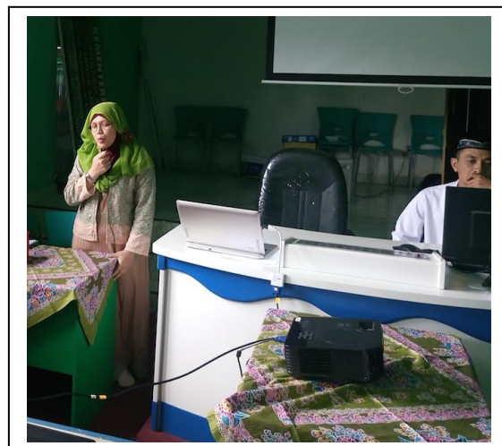
Gambar 3. Penyampaian Bahan Pelatihan oleh Ketua Pelaksana