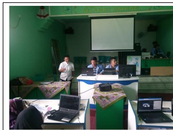
Gambar 4. Penyampaian Bahan Pelatihan oleh Mahasiswa Pendamping