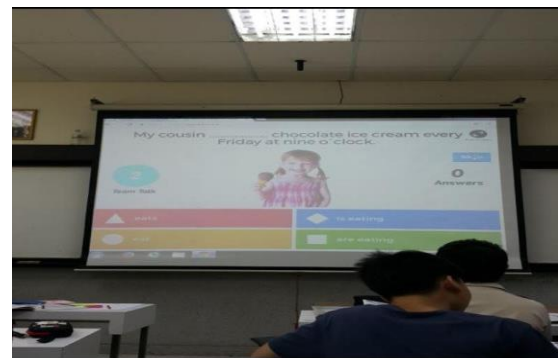
Gbr.2. Kahoot digunakan dalam pelajaran bahasa Inggris di sekolah menengah Thailand

Lecture Quiz 2.0 adalah prototipe pertama di mana baik guru dan siswa memiliki antarmuka web. Sebuah eksperimen yang menguji prototipe Lecture Quiz 2.0 menunjukkan bahwa kegunaan telah ditingkatkan baik untuk guru dan siswa, dan bahwa konsep tersebut meningkatkan motivasi, keterlibatan, konsentrasi, dan pembelajaran yang dirasakan siswa. Versi terakhir dari Lecture Quiz adalah versi 3.0 dengan antarmuka pengguna yang ditingkatkan secara