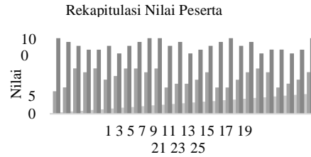
Gbr 3. Rekapitulasi Nilai Peserta Pelatihan

Peningkatan rata – rata nilai peserta berdasarkan persamaan :