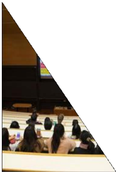
Gbr 1. Game Kahoot! sedang dimainkan di ruang kuliah di Universitas Oslo