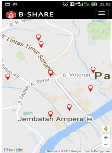
Gambar interface mobile application B-share

Aplikasi ini dapat di akses dengan semua jenis smartphone yang tersambung dengan internet. Database aplikasi ini berada pada server yang telah di uji sebelumnya. Aplikasi ini di desain dengan mempertimbangkan userexperience sehingga menghasilkan userinterface yang mudah dimengerti user dan mudah diterima sehingga dapat dimanfaatkan dengan baik.